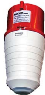
CÓDIGO: 103100102 Schuko Macho 32A 3-N-E 3SP1-025