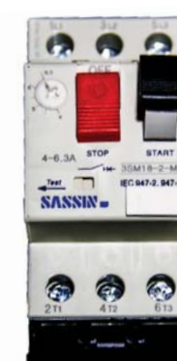
CÓDIGO: 103050102 Guarda Motor 6.3 - 4 A Sassin