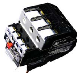
CÓDIGO: 103020710 Relé Térmico 30 - 40A Sassin