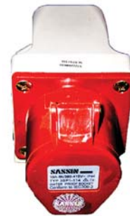
CÓDIGO: 103100205 Schuko Hembra 16A 3-E 3SP1-114