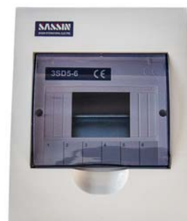
CÓDIGO: 103030202 Caja Sob P_6 Térmicos Sassin