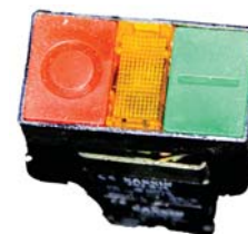
CÓDIGO: 103130103 Pulsador de Marcha y Parada Sassin