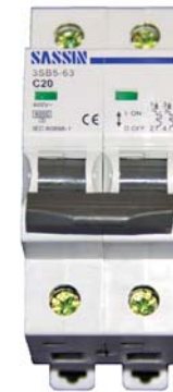
CÓDIGO: 103020204 Térmico 2x20 A Sassin