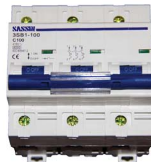
CÓDIGO: 103020310 Térmico 3x100 A Sassin