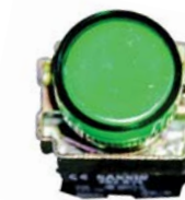
CÓDIGO: 103130101 Pulsador Indicador de Marcha Sassin