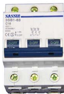
CÓDIGO: 103020302 Térmico 3x16 A Sassin