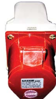
CÓDIGO: 103100206 Schuko Hembra 32A 3-E 3SP1-124