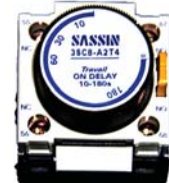
CÓDIGO: 103110202 Temp. Estrella Delta 10 - 180 S.