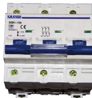
CÓDIGO: 103020309 Térmico 3x80 A Sassin