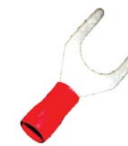
CÓDIGO: 103140203 Terminales U P-Ter- Contact Sassin SV 1.25-8