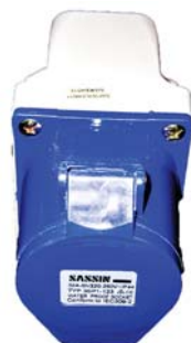
CÓDIGO: 103100204 Schuko Hembra 32A 2-E 3SP1-123