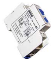
CÓDIGO: 103110104 Temp. Escalera 20min. 3SRC18 Sassin