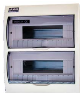
CÓDIGO: 103030206 Caja Sob P_24 Térmicos Sassin