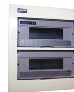
CÓDIGO: 103030106 Caja Emp P-24 Térmicos Sassin