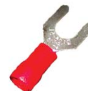
CÓDIGO: 103140201 Terminales U P-Ter- Contact Sassin SVM 1.25-4

Las terminales TIPO U con forro y pre aislamiento de Policloruro de vinilo (PVC) son utilizados como conectores para diversas aplicaciones.