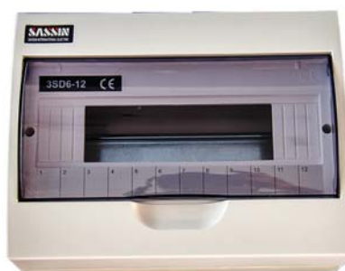
CÓDIGO: 103030204 Caja Sob P_12 Térmicos Sassin