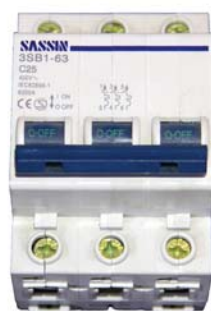
CÓDIGO: 103020304 Térmico 3x25 A Sassin