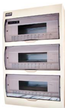
CÓDIGO: 103030207 Caja Sob P_36 Térmicos Sassin