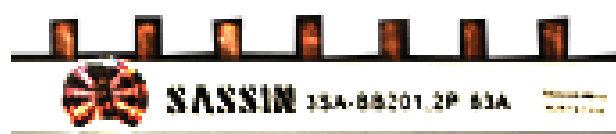
CÓDIGO: 103140102 Terminales Peine P-Ter. Sassin 3SA-BB 201-2P