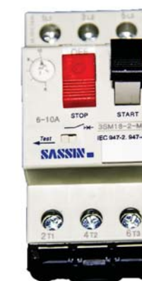
CÓDIGO: 103050103 Guarda Motor 06 - 10 A Sassin