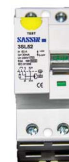
CÓDIGO: 103080105 Diferencial 2-63A - 30MA Sassin