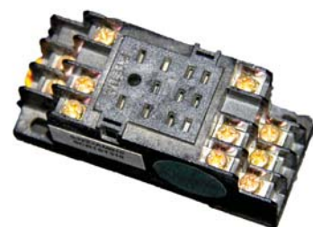
CÓDIGO: 103020802 Base de Relé auxiliar Sassin PYF11A