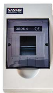
CÓDIGO: 103030201 Caja Sob P_4 Térmicos Sassin

La serie 3SD6 de cajas de distribución para empotrar, están concebidas para redes de tensión de trabajo de hasta 400V en 50Hz y 60Hz y hasta 63A. Permiten alojar elementos tradicionales modulares como: interruptores, diferenciales, etc...