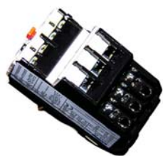
CÓDIGO: 103020701 Relé Térmico 2.5 - 4A Sassin

Las series de Relés térmicos de protección, están concebidos para circuitos en AC de 50/60 Hz. hasta 660V, en un rango de intensidades de 0.5 Amp. - 93 Amp. para la protección del motor frente a sobrecargas, pérdida de fase prolongada, desequilibrio o elevada rampa de arranque.