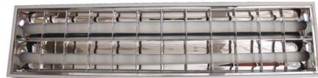
CÓDIGO: 10301012 Pant 2x40 Sassin Sobreponer