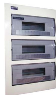
CÓDIGO: 103030107 Caja Emp P-36 Térmicos Sassin