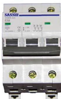
CÓDIGO: 103020305 Térmico 3x32 A Sassin