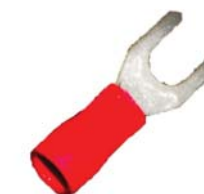
CÓDIGO: 103140202 Terminales U P-Ter- Contact Sassin SVL 1.25-5