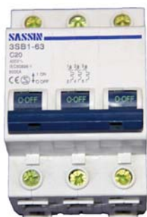
CÓDIGO: 103020303 Térmico 3x20 A Sassin