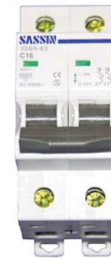
CÓDIGO: 103020203 Térmico 2x16 A Sassin