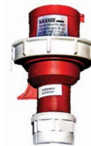
CÓDIGO: 103100301 Schuko Aéreo Macho 16A 3-E 3SP2-0141