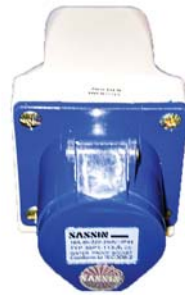
CÓDIGO: 103100203 Schuko Hembra 16A 2-E 3SP1-113