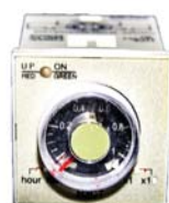
CÓDIGO: 103021003 Relé tiempo 10H AC-220V 3SH3CT-8H-D