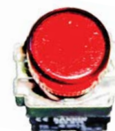
CÓDIGO: 103130102 Pulsador Indicador de Parada Sassin