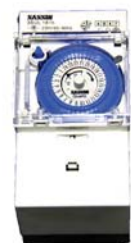
CÓDIGO: 103110102 Temp. Analógico 3SUL181H Sassin