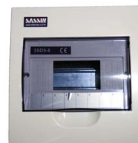
CÓDIGO: 103030103 Caja Emp P-8 Térmicos Sassin