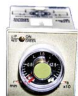
CÓDIGO: 103021001 Relé tiempo 30M AC-220V 3SH3CT-8H-B