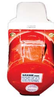
CÓDIGO: 103100202 Schuko Hembra 32A 3-N-E 3SP1-125