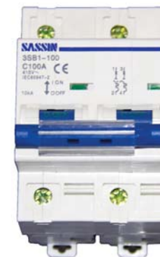
CÓDIGO: 103020211 Térmico 2x100 A Sassin