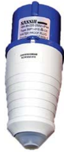
CÓDIGO: 103100103 Schuko Macho 16A 2-E 3SP1-013

Las tomas industriales tipo SCHUKO 3SP1 están concebidas para trabajos en condiciones adversas. De instalación sencilla alta fiabilidad y longevidad. Se emplean de manera especial en la industria de: construcción, vehículos industriales, etc. Fabricado con Nylon 66, de extremo aislamiento y resistencia térmica por encima de +120°C.