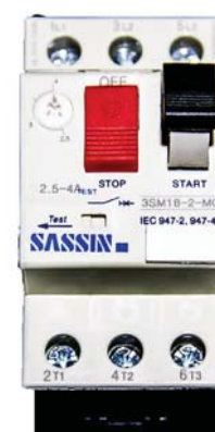
CÓDIGO: 103050101 Guarda Motor 2.5 - 4 A Sassin