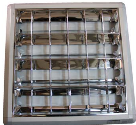
CÓDIGO: 103010111 Pant 4x20 Sassin Redondo Sobreponer