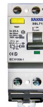
CÓDIGO: 103080101 Diferencial 2-25A - 30MA Sassin