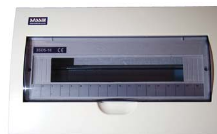
CÓDIGO: 103030105 Caja Emp P-18 Térmicos Sassin