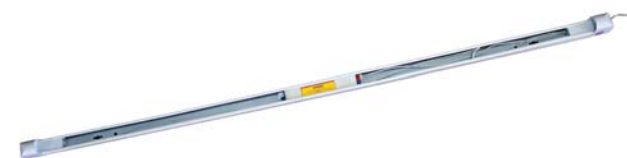
CÓDIGO: 103010201 Pant 1x40 C Tapa C rect Elec Sassin