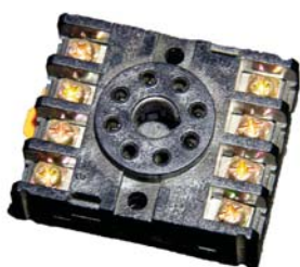
CÓDIGO: 103020801 Base de Relé Tiempo Sassin PF831