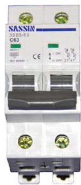
CÓDIGO: 103020209 Térmico 2x63 A Sassin