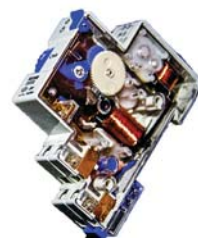
CÓDIGO: 103110103 Temp. Escalera 7min. 3SE8 Sassin