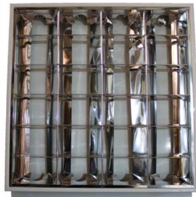
CÓDIGO: 10301019 Pant 4x20 Sassin Empotrar