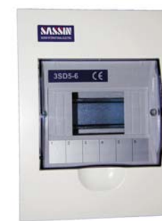
CÓDIGO: 103030102 Caja Emp P-6 Térmicos Sassin