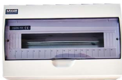
CÓDIGO: 103030205 Caja Sob P_18 Térmicos Sassin