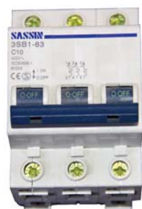
CÓDIGO: 103020301 Térmico 3x10 A Sassin