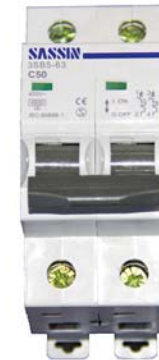
CÓDIGO: 103020208 Térmico 2x50 A Sassin