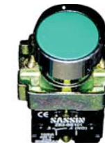
CÓDIGO: 103130104 Pulsador de Marcha Sassin