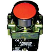
CÓDIGO: 103130105 Pulsador de Parada Sassin