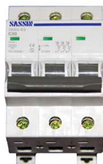
CÓDIGO: 103020307 Térmico 3x50 A Sassin