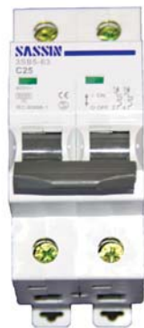
CÓDIGO: 103020205 Térmico 2x25 A Sassin