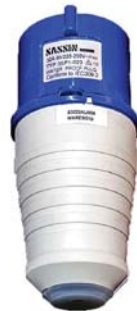
CÓDIGO: 103100104 Schuko Macho 32A 2-E 3SP1-023