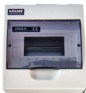
CÓDIGO: 103030203 Caja Sob P_8 Térmicos Sassin