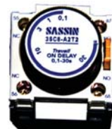
CÓDIGO: 103110201 Temp. Estrella Delta 0.1 - 30S