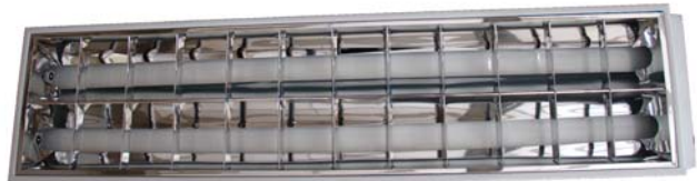
CÓDIGO: 10301013 Pant 2x20 Sassin Empotrar