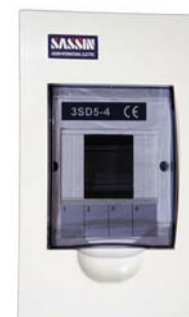
CÓDIGO: 103030101 Caja Emp P-4 Térmicos Sassin

La serie 3SD5 de cajas de distribución para empotrar, están concebidas para redes de tensión de trabajo de hasta 400V en 50Hz y 60Hz y hasta 63A. Permiten alojar elementos tradicionales modulares como: interruptores, diferenciales, etc...