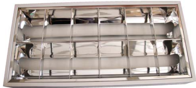
CÓDIGO: 10301011 Pant 2x20 Sassin Sobreponer

El diseño elegante, exquisito y su conveniente instalación hacen de las pantallas Sassin ideales para ser utilizadas dentro de los sistemas de iluminación para oficinas, recepciones, salas, bancos, hoteles y viviendas en general; pudiendo elegir entre pantallas de empotrar y de sobre poner en superficie.