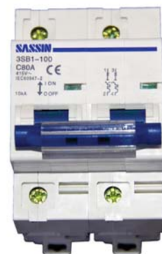
CÓDIGO: 103020210 Térmico 2x80 A Sassin