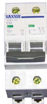
CÓDIGO: 103020206 Térmico 2x32 A Sassin