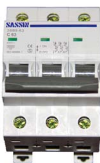
CÓDIGO: 103020308 Térmico 3x63 A Sassin