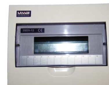
CÓDIGO: 103030104 Caja Emp P-12 Térmicos Sassin