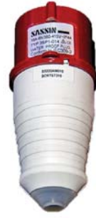
CÓDIGO: 103100105 Schuko Macho 16A 3-E 3SP1-014