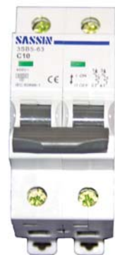
CÓDIGO: 103020202 Térmico 2x10 A Sassin