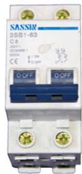
CÓDIGO: 103020201 Térmico 2x6 A Sassin